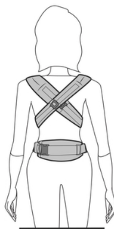
クロス装着も可能